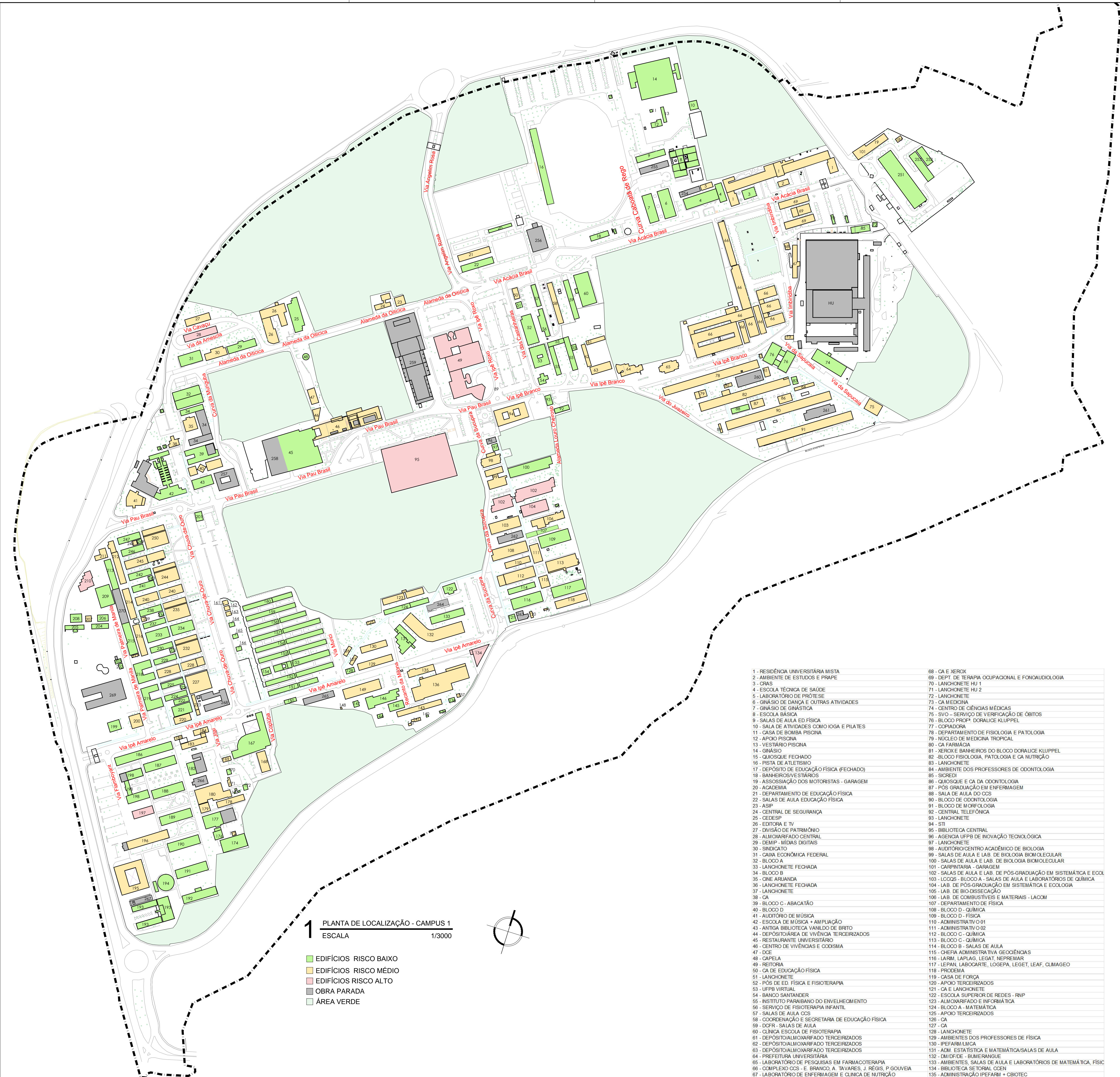
1 PLANTA DE LOCALIZAÇÃO - CAMPUS I ESCALA 1/3000