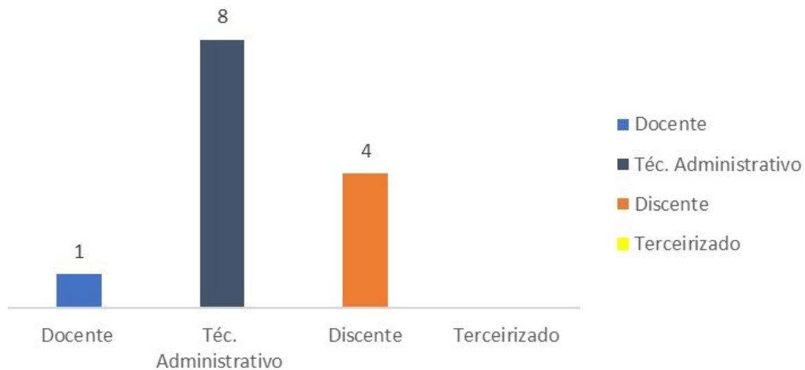
Distribuição dos testes de RT-PCR por vínculo institucional