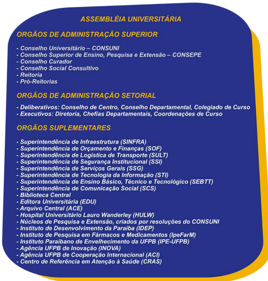
Figura 2 – Estrutura organizacional da UFPB