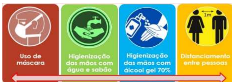
Fig. 1. Medidas de prevenção de contágio pelo novo coronavírus.