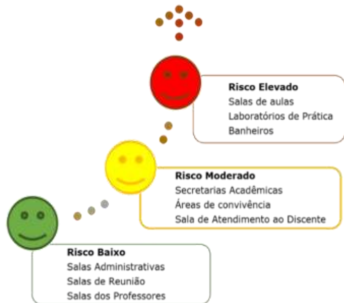
Fig. 1. Potencial de risco de acordo com as áreas de trabalho e ensino

O risco é a probabilidade de perigo, com ameaça física para o homem e/ou para o meio ambiente. O risco associado a COVID-19 é a probabilidade de uma pessoa ser contaminada em virtude do contato com outras pessoas portadoras do vírus. Os grupos de risco se referem às pessoas que tem maior chance de desenvolver as formas graves da COVID-19. A figura ao lado representa os locais de riscos de contaminação associados às atividades realizadas no âmbito do DENC e Laboratórios considerando os locais com ventilação natural, o controle de circulação de pessoas e a manutenção das medidas preventivas de contaminação.