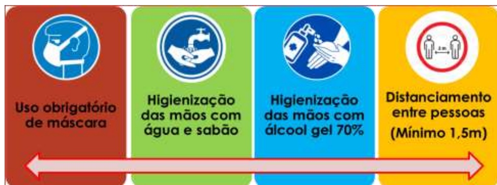
Fig. 2. Medidas de prevenção de contágio pelo novo coronavírus.

As recomendações gerais direcionadas às pessoas que frequentem os ambientes do DENC ou dos Laboratórios terão como focos principais as medidas de proteção individual e coletiva abaixo relacionadas: