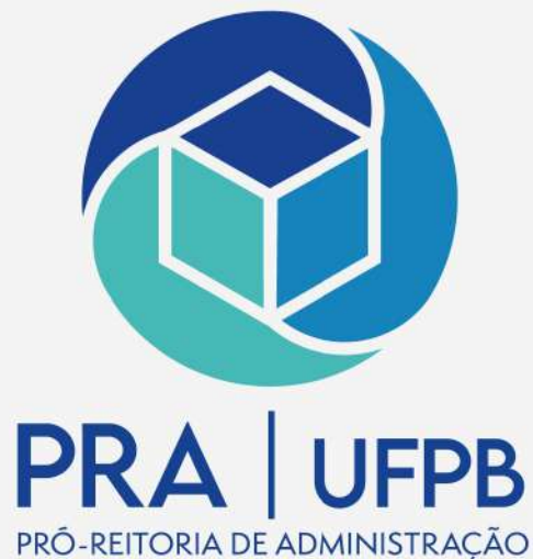
Versão preferencial I (logo vertical)