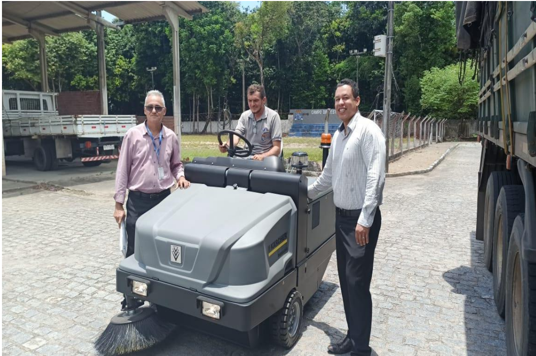
Figura 4 e 5 – Varredeira de piso