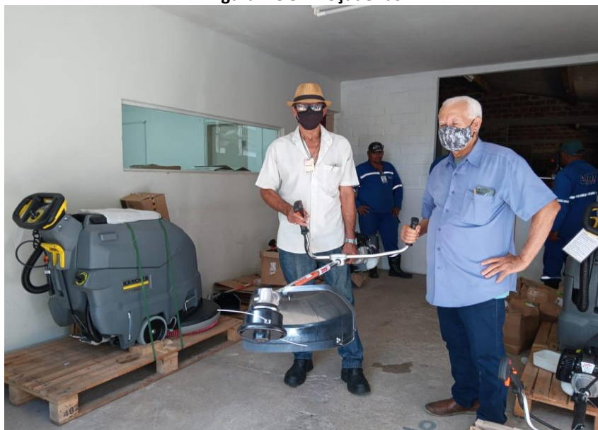
Figura 7 e 8 – Roçadeiras