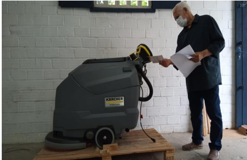
Figura 6 – Lavadora de piso