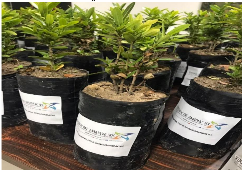
Figura 9 – Mudanças de Ixora