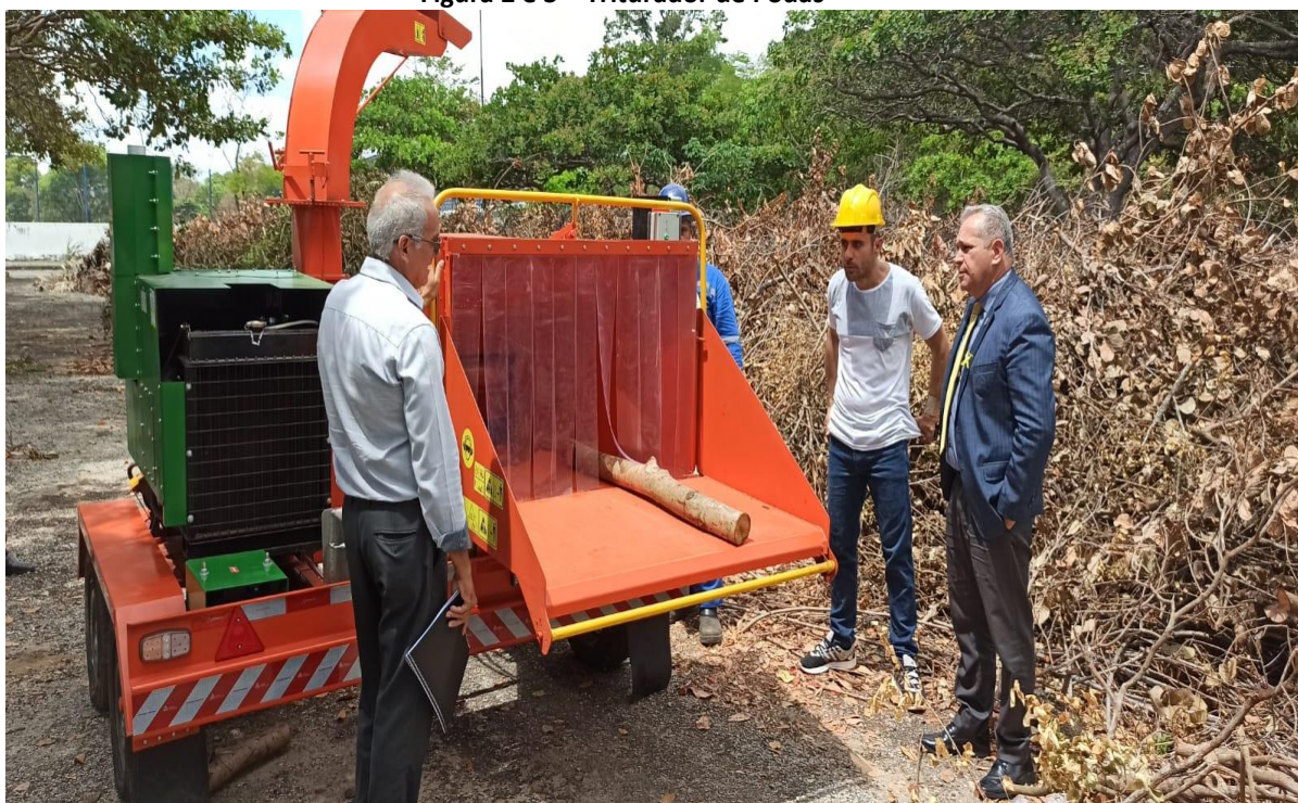
Figura 2 e 3 – Triturador de Podas